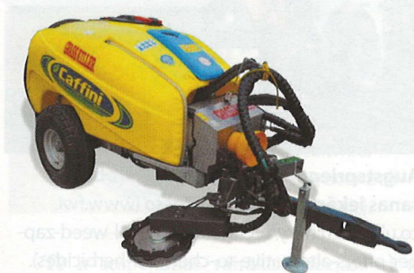
Augstspiediena (1000 bar) ūdens strūklas nezāļu ierobežošanas iekārta GrassKiller Mono no Caffini .

Jau 1975. gadā eksperimentāli tika novērtēta tievas ūdens strūklas spēja nogriezt/sabojāt augu. Rezultāti parāda, ka aptuveni 60–70% no augiem tika būtiski sabojāti, ja to kātiņa diametrs nepārsniedza 1,5 mm, savu-